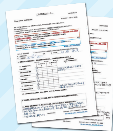
「ご入居者アンケート」

一般的に汚い場所と思われがちなゴミ置場が綺麗に保たれていると、管理体制や入居者の質の高さが伺え、部屋探しの方々にも良い印象を持ってもらえます