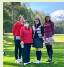
クリタ 東京南支店 栗田

重要なのはやっぱり コミュニケーション！ ～チームプレーでより良い 仕事をしていきます～